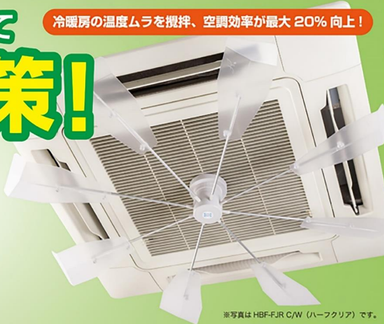
※写真は HBF-FJR C/W (ハーフクリア) です。

天井の空調機にファンを取り付けるだけでエアコンの直撃風を解消。空調効率がアップし、電気代が削減できます。